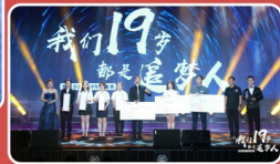
“追梦人”演讲颁奖典礼

是梦想，让我们不忘初心，坚定信念；是梦想，召唤我们向前奔跑，不惧未来；是梦想，指引我们砥砺前行，永不止步；是梦想，给予我们力量，让我们在奋斗的路上不再彷徨。愿梦想为所有创典人插上翅膀，照亮方向，在战场上翱翔，因为我们19岁，都是追梦人！