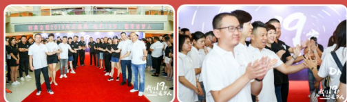
创典主要股东们红毯列队迎接铁军伙伴入场

2019年8月16日，创典全程2019年庆盛典——“我们19岁 都是追梦人”在西安曲江国际会议中心璀璨绽放。18岁，我们信则成，下势干，造未来；19岁，我们怀揣梦想，奔向远方！