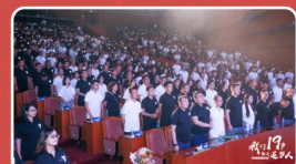
全场齐唱《歌唱祖国》，晚会圆满落幕

是梦想，让我们不忘初心，坚定信念；是梦想，召唤我们向前奔跑，不惧未来；是梦想，指引我们砥砺前行，永不止步；是梦想，给予我们力量，让我们在奋斗的路上不再彷徨。愿梦想为所有创典人插上翅膀，照亮方向，在战场上翱翔，因为我们19岁，都是追梦人！